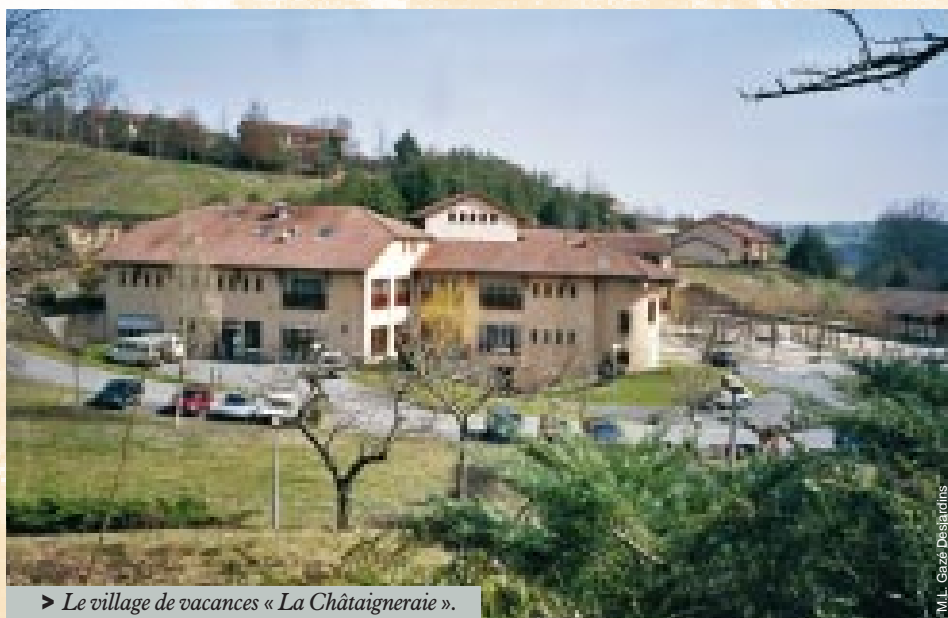
> Le village de vacances « La Châtaigneraie ».

À MAURS-LA-JOLIE DANS LE CANTAL, LE CENTRE DE RÉADAPTATION POUR MALADES MENTAUX EST ADOSSÉ À UN VILLAGE DE VACANCES. OUVERT DEPUIS PRÈS DE QUINZE ANS, C'EST LE PLUS RÉCENT DES ÉTABLISSEMENTS DE CE TYPE CRÉÉ PAR LA MUTUALITÉ AGRICOLE. ÉCLAIRAGE.