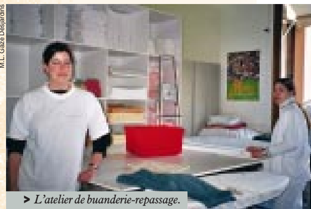
➤ L'atelier de buanderie-repassage.

coolisme, la drogue et la violence. Pris en flagrant délit, ils sont renvoyés chez eux dans les heures qui suivent. Certains ont eu dans le passé des contacts avec la drogue ou l'alcool, mais ce n'est pas ce qui les a conduits là, c'est toujours la maladie mentale. La durée du séjour – entre 12 et 18 mois pour la majorité, le maximum étant de 24 mois – est fonction de la pathologie initiale (particulièrement schizophrénie et psychoses...) et de son évolution. On observe ces dernières années, selon les responsables du centre, une diminution relative du temps de réadaptation, une légère baisse de la moyenne d'âge (24-25 ans actuellement). Autre évolution constatée : quelques jeunes patients n'ont eu aucun contact avec le monde professionnel auparavant et pour eux le travail n'a aucune signification. Il est alors plus difficile de les motiver. Heureusement ce n'est pas une généralité. S'ils peuvent partir de leur propre initiative contre l'avis médical – avec le risque, en cas de rechute, de retourner en hôpital psychiatrique –, certains parviennent bien à bâtir un projet professionnel (parfois en milieu ordinaire, plus souvent