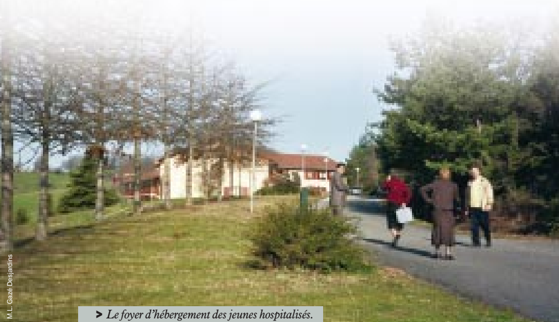
➤ Le foyer d'hébergement des jeunes hospitalisés.

➤ d'une réadaptation par le biais des métiers de l'hôtellerie a été fait et l'implantation d'une structure de vacances de grand confort, décidée.