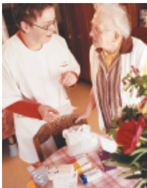
⬆ Médicaments : à consommer avec modération. p.28