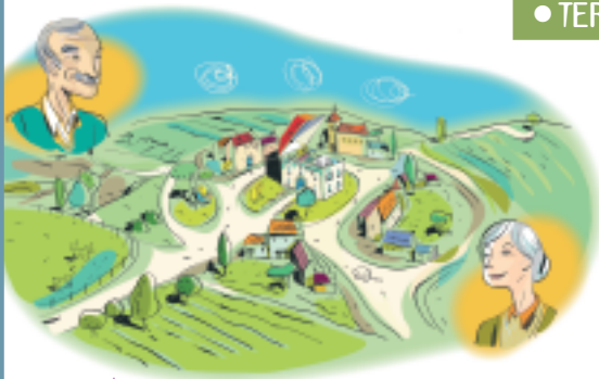
⬆ Vieillir chez soi, dans son village. p.16