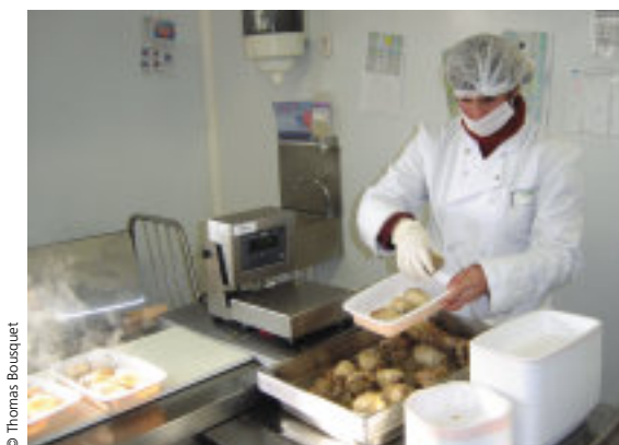
Conditionnement des repas préparés par le centre de restauration de l'hôpital de Saintes.

Une structure originale concentre l'essentiel des services proposés par le Groupe MSA de la Charente-Maritime, l'association AIDER 17. L'aide ménagère le portage à domicile, les travaux administratifs, l'assistance à domicile, les services de remplacement (liés à des congés, une maladie, un accident, une formation), et enfin la mise à disposition de personnel sont ses principales activités.